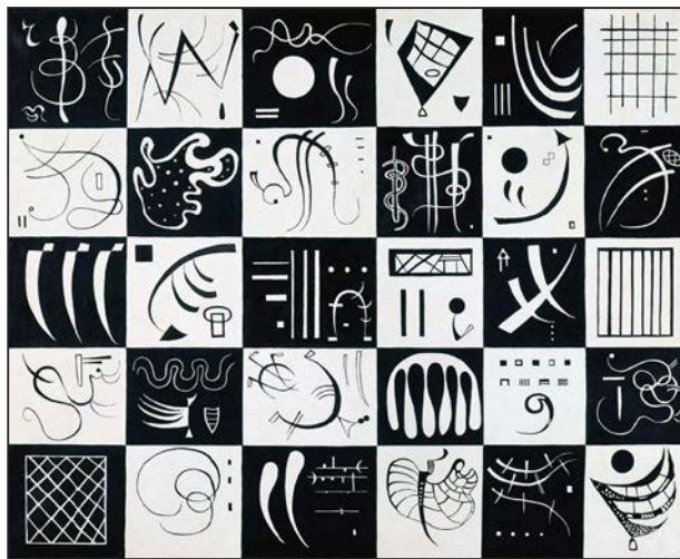
V. Kandinskij, Třicet, 1937, olej na plátně

sovětským komunistům, tak i německým nacistům. Kandinskij je známý hlavně jako jeden z průkopníků největší revoluce v malířství, která se nazývá abstraktní umění, v němž se na obrazech nezobrazují konkrétní předměty. Abstrakce nejvíce využívá barvy a barevné plochy, které jsou základem obrazu, dále pak pravidelné tvary a linie. Kandinskij experimentoval s barvami i liniemi, jako by skládal hudbu. „Barva je síla, která přímo ovlivňuje duši. Barva je klávesnice, oči jsou kladívka a duše je piano se strunami,“ popisoval malíř.