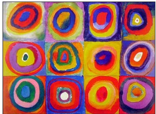
V. Kandinskij, Čtverce se soustřednými kruhy, 1913, akvarel, tempera a voskovky na papíře